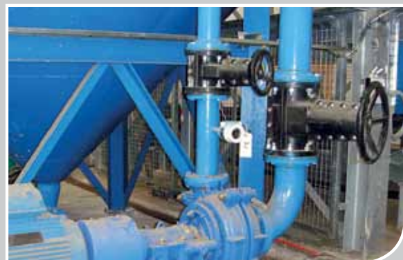
在Sims 金属再生公司的枫诺PVEG 阀门

在2011年初，Sims 金属再生公司在英国的一个金属再生工厂选用了枫诺PVEG 阀门。手动操作，且重量轻盈的PVEG 阀门用于重介质选矿中泵和料罐的隔离。枫诺产品成为Sims公司在新产品和分离技术方面持续投资的重要部分，并用最少的成本，为公司回收了最多的金属。