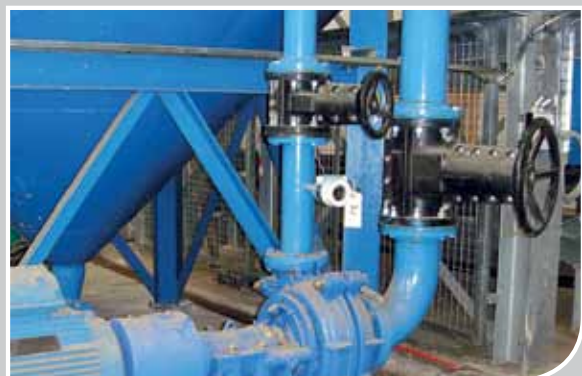
在Sims 金属再生公司的枫诺PVEG 阀门

在2011年初，Sims 金属再生公司在英国的一个金属再生工厂选用了枫诺PVEG 阀门。手动操作，且重量轻盈的PVEG 阀门用于重介质选矿中泵和料罐的隔离。枫诺产品成为Sims公司在新产品和分离技术方面持续投资的重要部分，并用最少的成本，为公司回收了最多的金属。