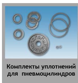
Комплекты уплотнений для пневмоцилиндров