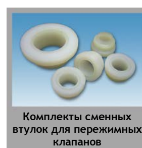
Комплекты сменных втулок для пережимных клапанов

Предоставленная выше информация не налагает на производителя никаких обязательств. Все права на внесение изменений без предварительного уведомления защищены.