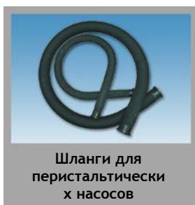
Шланги для перистальтических насосов

Запасные части для клапанов и насосов Flowrox: